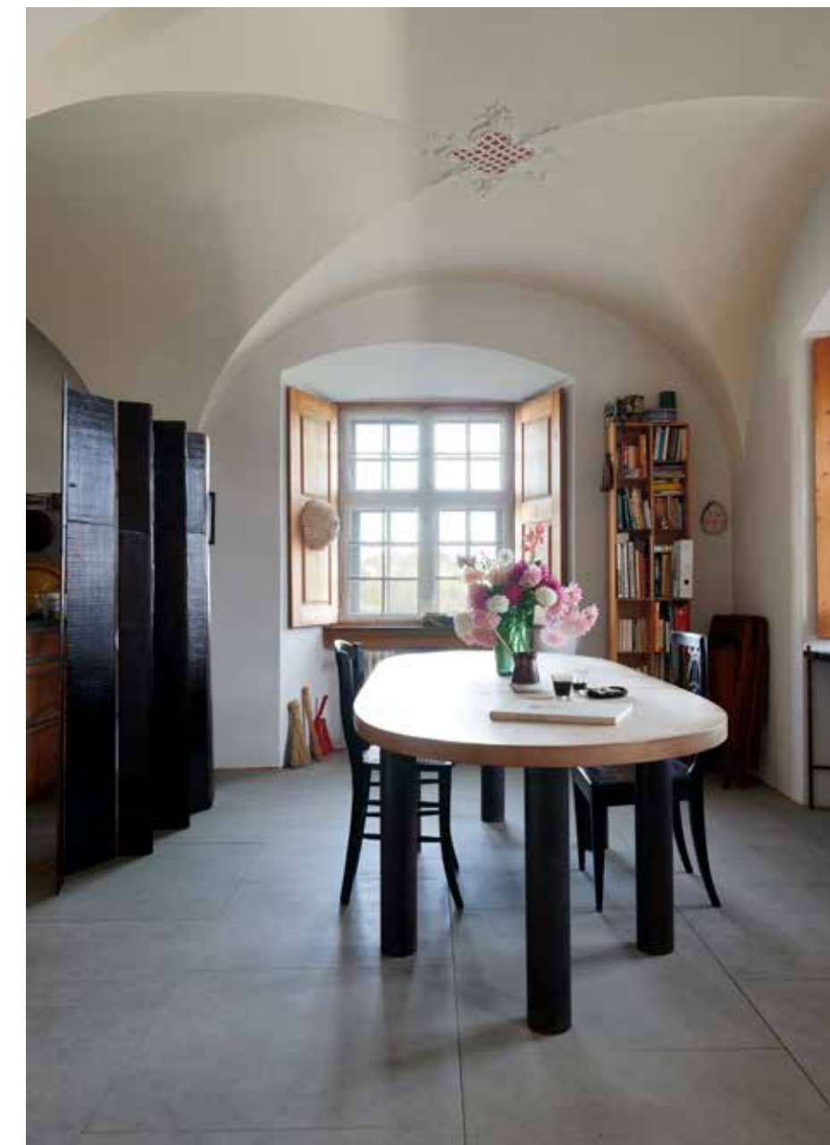
Die elegant gewölbten Decken mit den Stukkaturen prägen die Atmosphäre der Wohnung. Tisch: Eigentwurf.