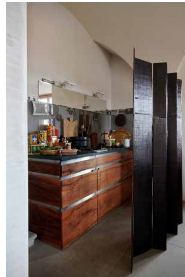
Die Küchenzeile wird diskret durch einen Urushi-Paravent verdeckt. Im Zeitalter des nomadischen Wohnens müssten Paravents zur Standardausrüstung gehören.