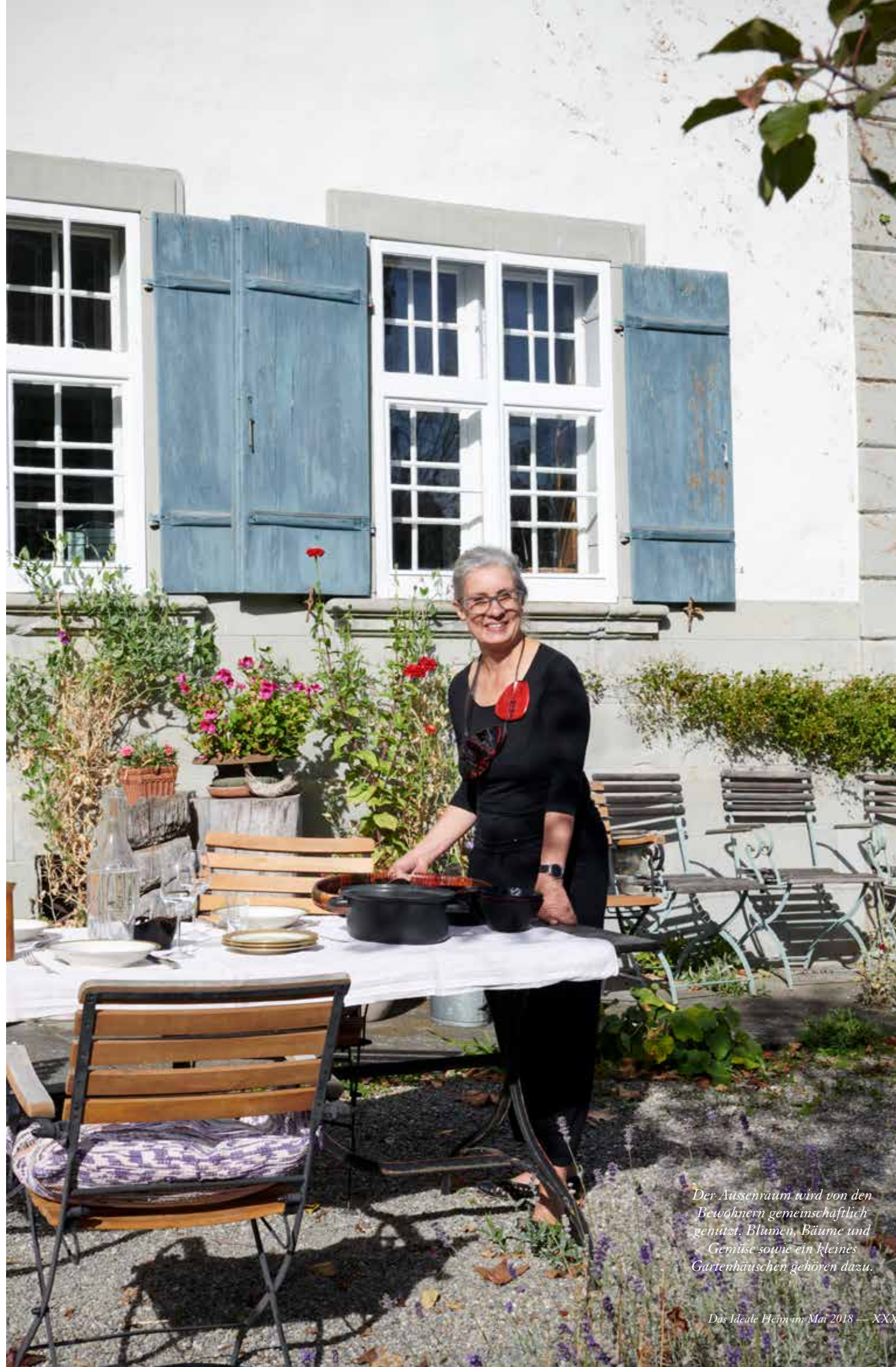
Der Aussenraum wird von den Bewohnern gemeinschaftlich genutzt. Blumen, Bäume und Gemüse sowie ein kleines Gartenhäuschen gehören dazu.