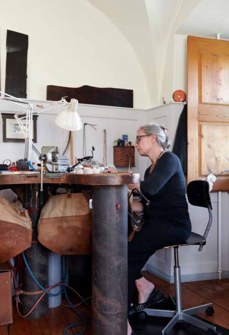
Auch Eierschalen oder andere organische Materialien wie Knochen oder Kokosshalen verarbeitet die Künstlerin zu Schmuckstücken.

ranken und Perlen in einem ganz neuen Licht erscheinen lassen. «Ich mag solche Formen der Verunsicherung, daraus schöpfe ich meine Inspiration», sagt sie im Gespräch. Und erzählt gleich das nächste Beispiel einer verrückten Kreation.