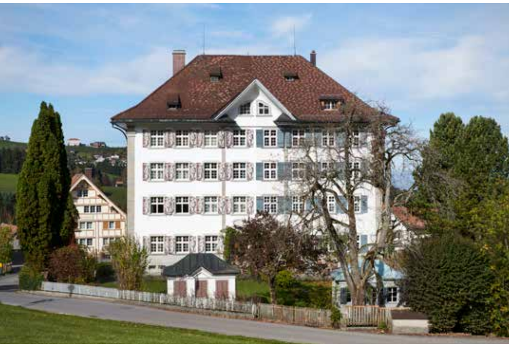
Der Honnerlagsche Doppelpalast wurde 1763 erbaut. Baumeister war Johannes Grubenmann.