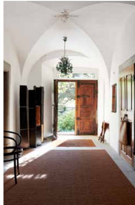
Später wurde die nordöstliche Hälfte des Baus mit Stukkaturen ergänzt. Der Paravent im Eingang ist auch eine Arbeit von Salome Lippuner.