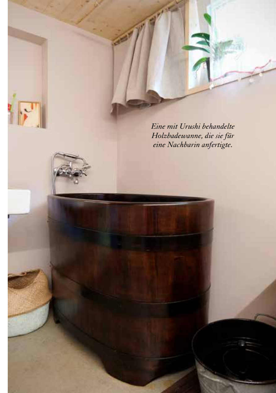
Eine mit Urushi behandelte Holzbadewanne, die sie für eine Nachbarin anfertigte.

den 1763 erbauten Doppel-Palast etwas ausserhalb des Zentrums und liess die nordöstliche Hälfte des viergeschossigen Steinbaus mit Stukkaturen versehen. Sein Sohn Johann Conrad Honnerlag (1777- 1838) ergänzte die Honnerlagsche Anlage durch Gärten. Der Kunst- und Literaturliebhaber förderte Kultur und Institutionen im Ort. Mitte des 19. Jahrhunderts starb das letzte Familienmitglied der Honnerlag.