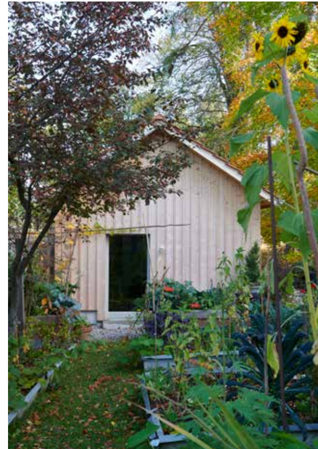
Auf der Honnerlagschen Anlage wohnen verschiedene Kunstschaffende.