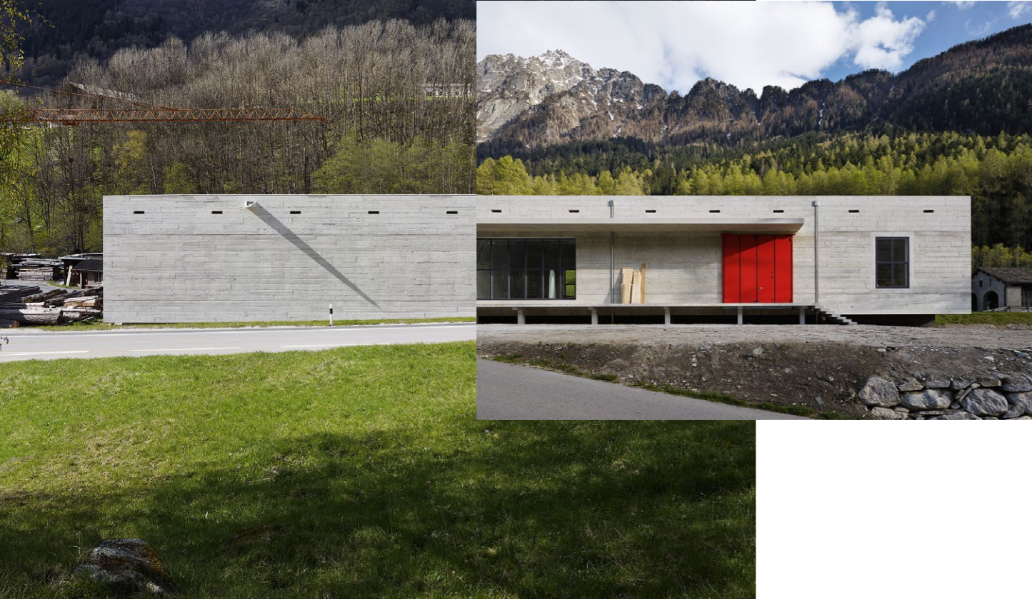
Magazin und Atelier für Mirjam Cahn, Stampa (2014–2016).