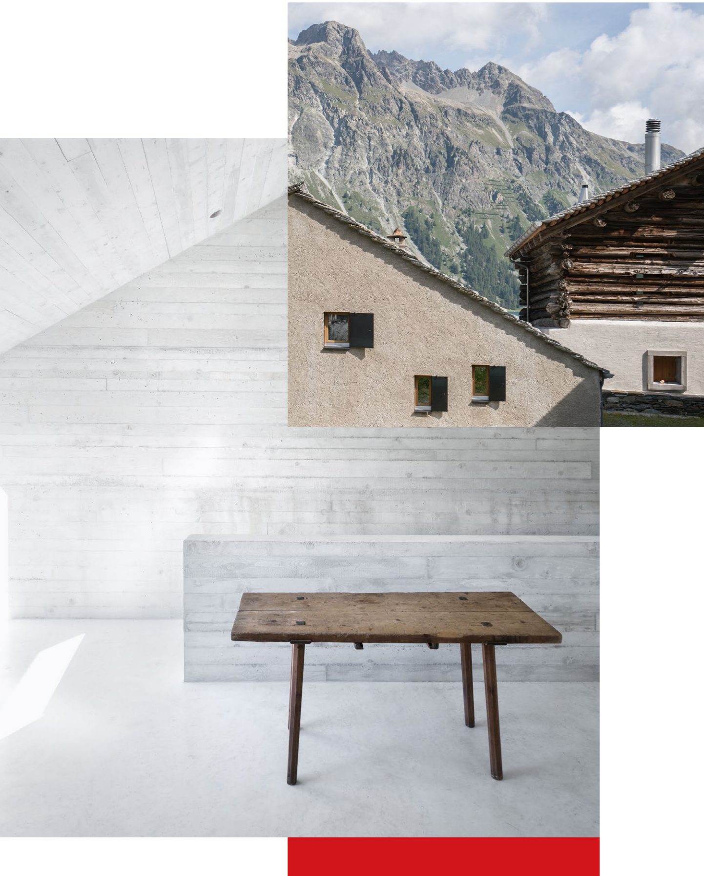
Umbau eines Stalles und Sanierung einer Meierei, Isola (2013–2018).