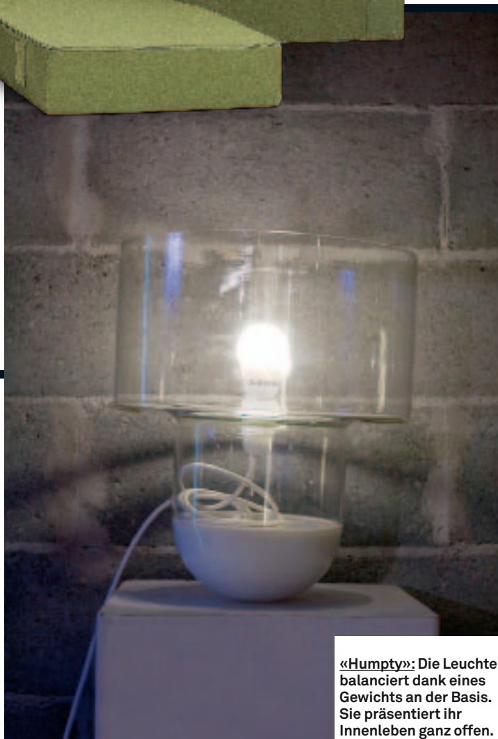
«Humpty»: Die Leuchte balanciert dank eines Gewichts an der Basis. Sie präsentiert ihr Innenleben ganz offen.