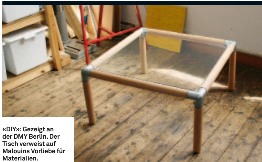
«DIY»: Gezeigt an der DMY Berlin. Der Tisch verweist auf Malouins Vorliebe für Materialien.

Das Prinzip des intelligenten Aneinanderfügens ist bei Malouins Vorgehen das charakteristische Element.