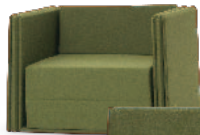
«Tent Sofa»: Das verwechselbare Sofa für Kinder wurde für die italienische Firma Campeggi kreiert.