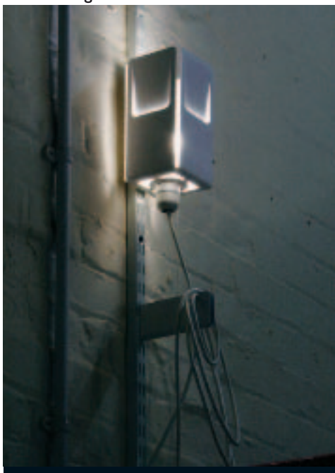
«Andy Lamp»: Teil der «Standard Range»-Kollektion knüpft die Lampe an ein existierendes Design an.