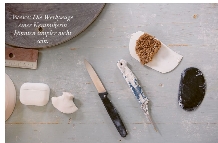
Basics: Die Werkzeuge einer Keramikerin könnten simpler nicht sein.