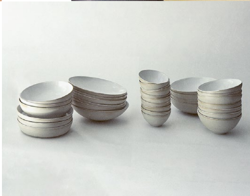
LUCIDE KKL KUNSTHAUSBAR