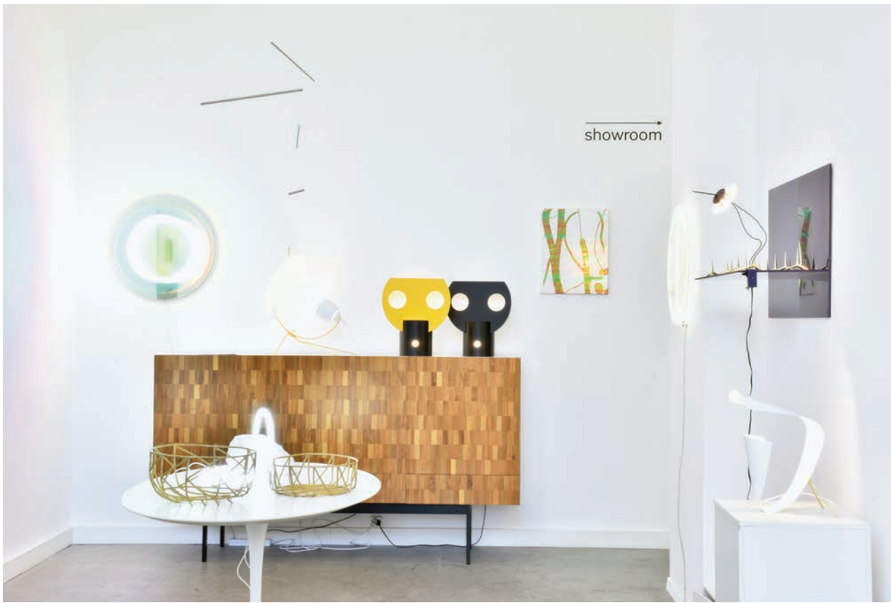
Kissthedesign in Lausanne: Corine Stübi und Yanick Fournier zeigten erst Kunst, nun kombinieren sie Vintage-Möbel mit limitierten Editionen.