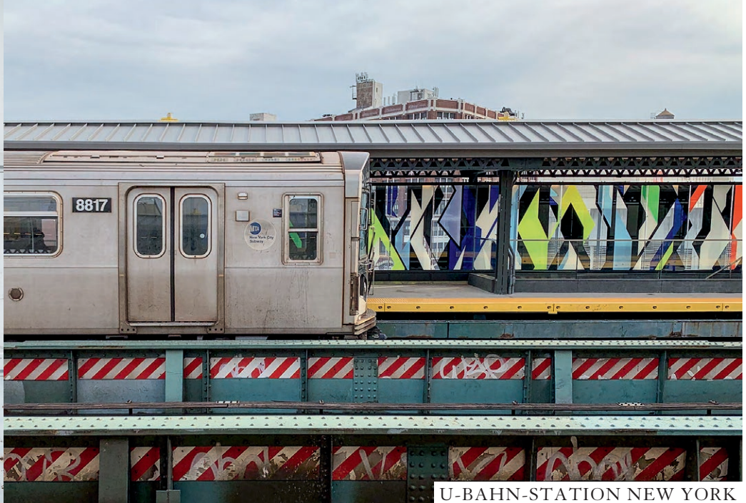
U-BAHN-STATION NEW YORK