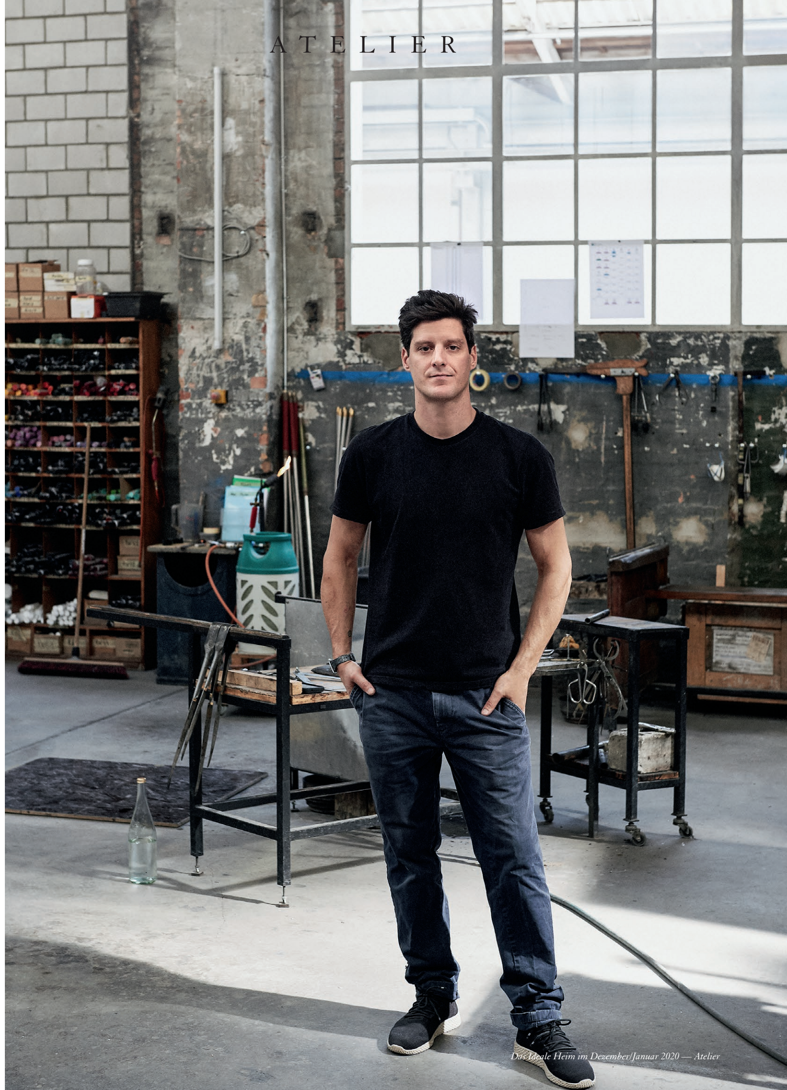
Das ideale Heim im Dezember/Januar 2020 — Atelier