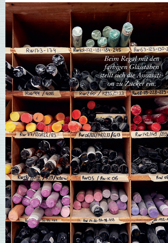
Beim Regal mit den farbigen Glasstäben stellt sich die Assoziation zu Zucker ein.