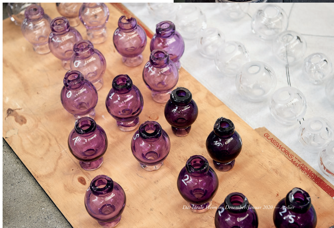
Das Ideale Heim im Dezember/Januar 2020 — Atelier