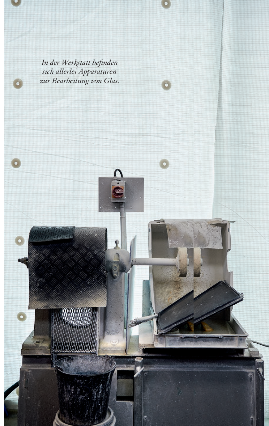
In der Werkstatt befinden sich allerlei Apparaturen zur Bearbeitung von Glas.

MG: Es geht für mich nicht primär um das Beherrschen einer Technik, also um reine Wiederholung, sondern um den Aspekt des Erforschens. Das zeichnet für mich Handwerk aus. Ein Handwerker muss ja teilweise seine Werkzeuge selber herstellen. Die Kreativität der Handwerker zeigt sich nicht auf den ersten Blick, aber wir sind eigentlich von morgens bis abends kreativ.