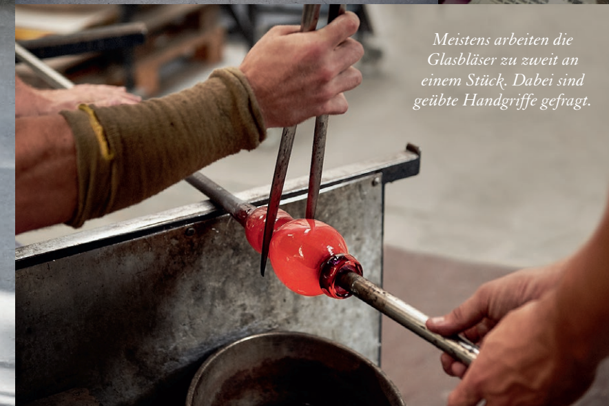
Meistens arbeiten die Glasbläser zu zweit an einem Stück. Dabei sind geübte Handgriffe gefragt.