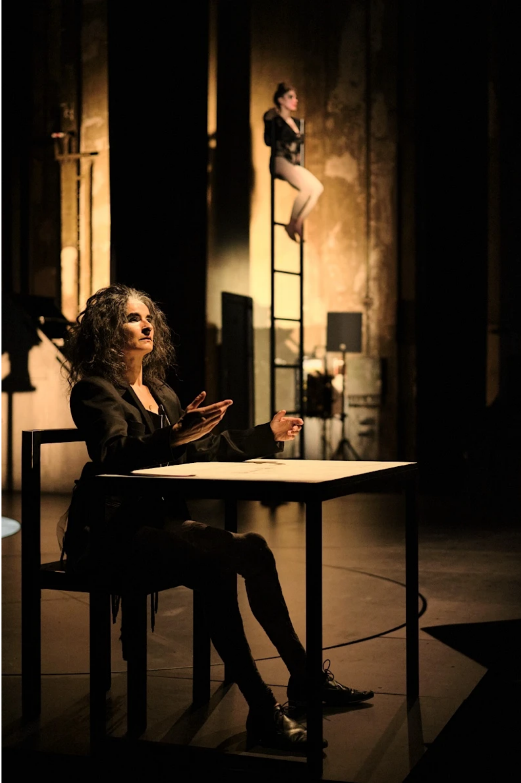
Zimmermanns Figuren geraten in der Schiffbauhalle wiederholt in Schiefelage – in mehrerlei Hinsicht.